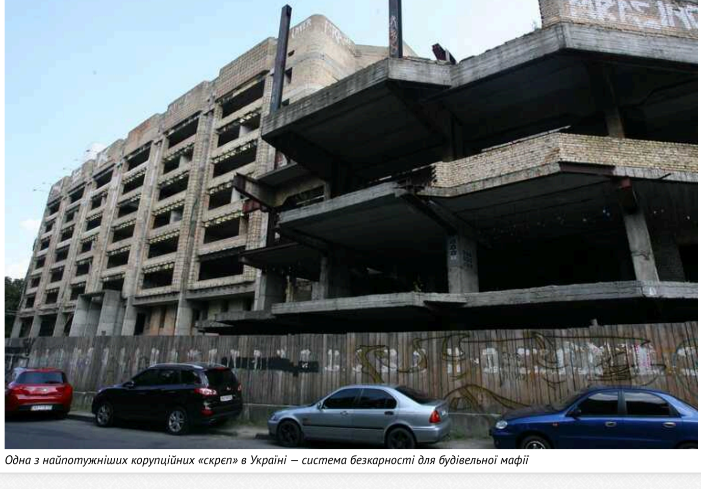
Одна з найпотужніших корупційних «скреп» в Україні — система безкарності для будівельної мафії

Журналісти видання «Наші гроші» отримали офіційні дані, що підтвердили озвучене в неофіційних розмовах учасників будівельного ринку.