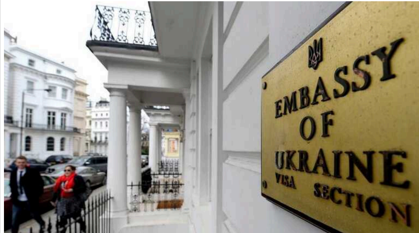
У Лондоні консульство України закликала українців за кордоном стати на військовий облік

Там заявляють, що за чинним законодавством (ухвала Кабінету №1487 від 30.12.2022) призванники, військовозобов'язані та резервісти мають стати на військовий облік у разі від'їзду за межі України на строк більше трьох місяців – за місцем консульського обліку у закордонних дипломатичних установах України.