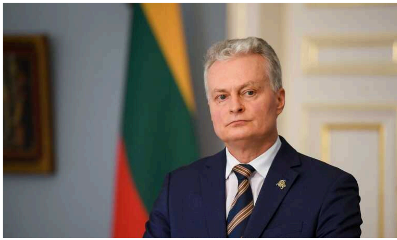
Литва схвалила довгостроковий пакет підтримки України

Литва схвалила пакет довгострокової військової допомоги Україні на суму 200 млн євро. Також аносовано нові поставки на січень та лютий.