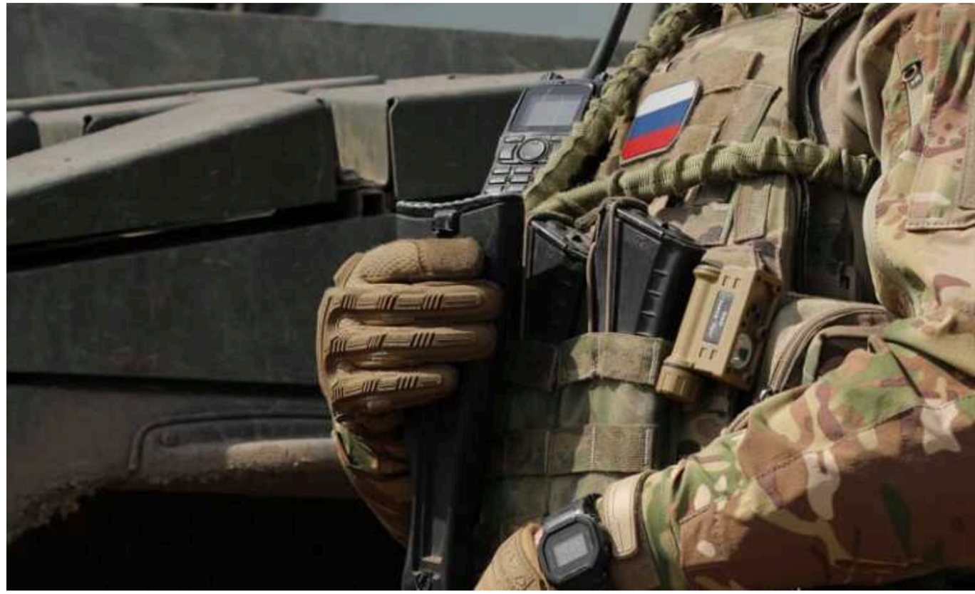
На Донецькому напрямку оперує найбільш чисельне та найбільш боєздатне угруповання ворога

Про те, що відбувається після Нового року, на Донецькому плацдармі розповів військово-політичний експерт і координатор Інформаційного Опору Олександр Коваленко.