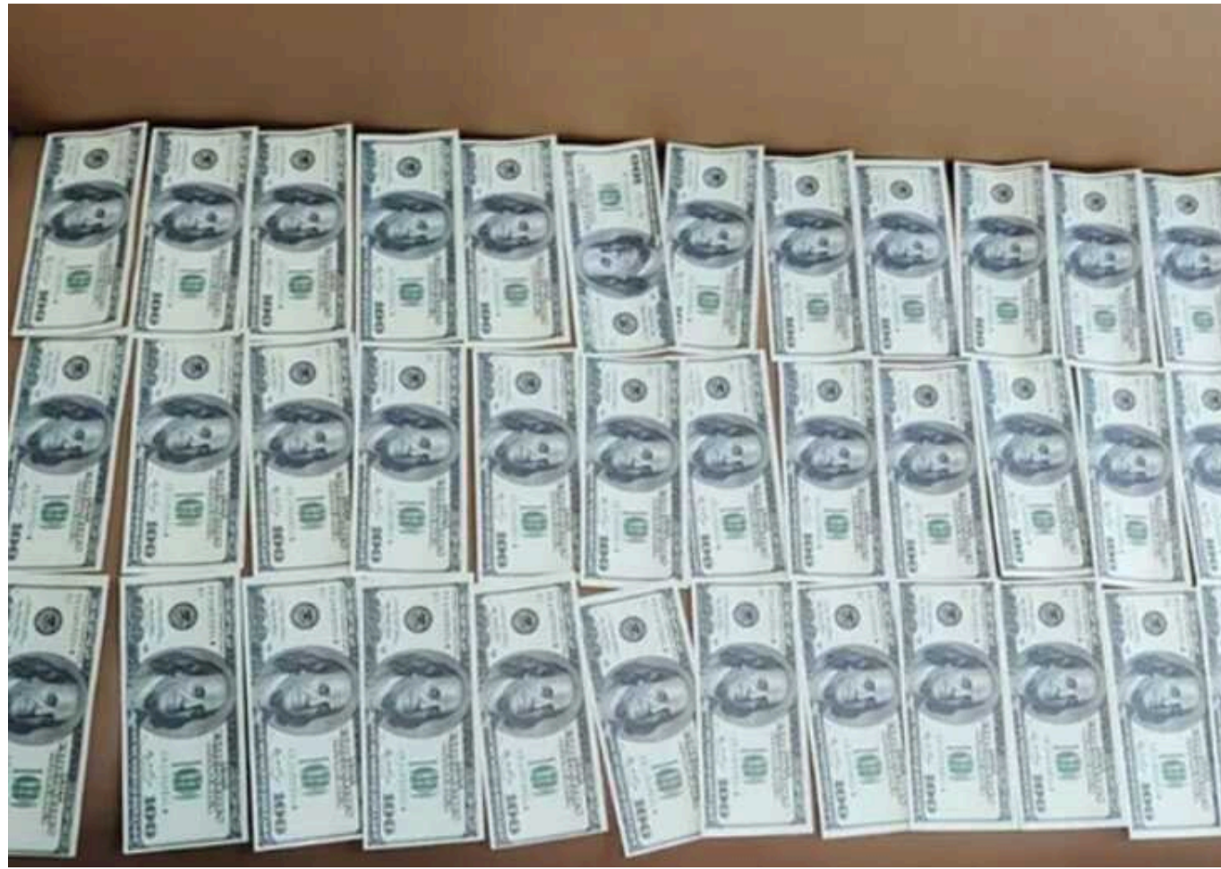
У Києві чоловік за 8,5 тисячі доларів обіцяв ухилинтам вирішити питання про непридатність до військової служби

У Києві правоохоронці викрили зловмисника, який обіцяв вирішити питання щодо непридатності до несення військової служби чоловікам призовного віку. Свої "послуги" він оцінив у 8500 доларів США.