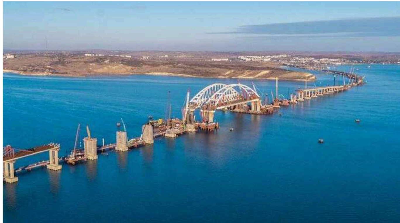
Військовий експерт пояснив, яка зброя дала б змогу ЗСУ знищити Керченський міст

Знищити Кримський міст українські війська могли б насамперед крилатими ракетами Taugus, а також балістичними ATACMS з бойовою частиною осколково-фугасного типу і дальністю до 300 км. Поки партнери не поспішають передавати Україні таке озброєння, однак Сили оборони частково вже виконують завдання з деокупації Криму іншими засобами.