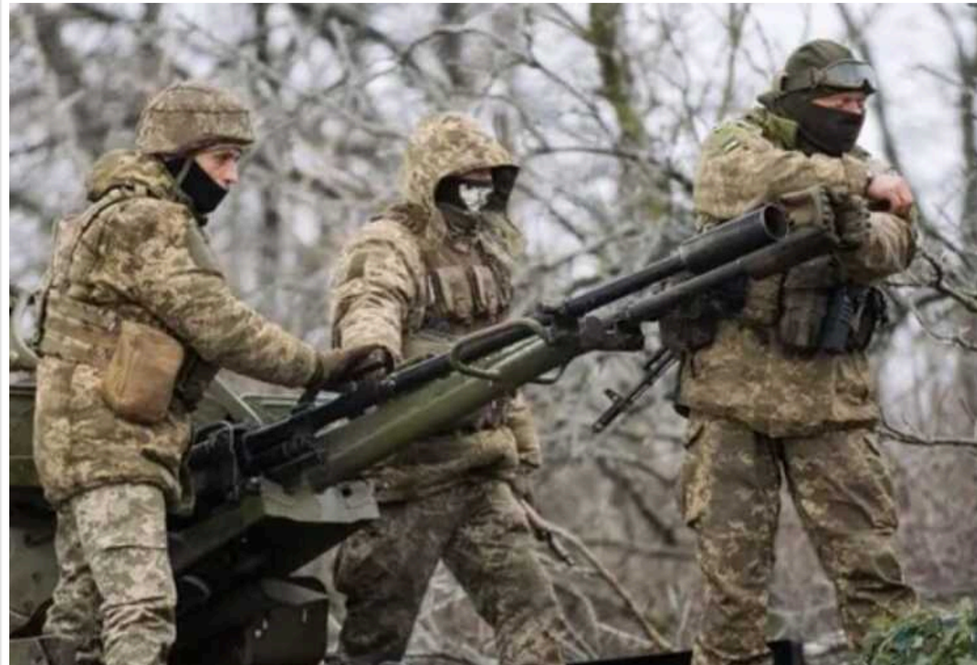
В ЗСУ розповіли, як вплинула погода на ситуацію на лівобережжі Херсонщини

Стрімке погіршення погодних умов в Україні вплинуло на ситуацію на полі бою, зокрема – на лівобережжі Херсонщини, де українські воїни утримують плацдарм. З одного боку, поривчастий вітер заважає росіянам атакувати позиції Сил оборони з тактичної авіації, з іншого – важче стало працювати й українській аеророзвідці.