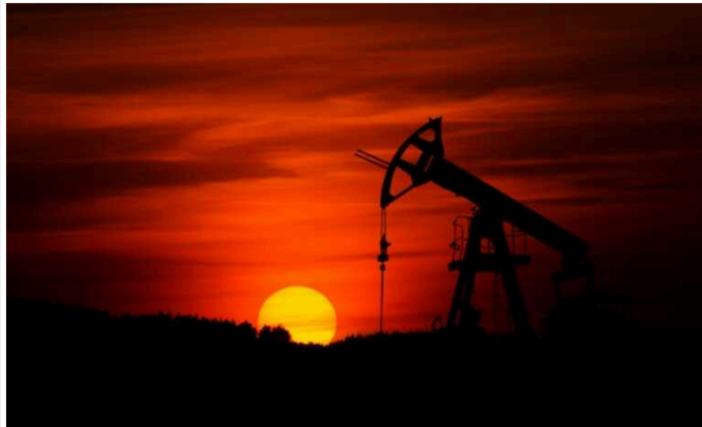
Bloomberg: Бум буріння нафти в РФ доводить слабкість санкцій Заходу

У 2023 році Росія наблизилася до другого року рекордного буріння нафти, що є ще одним доказом низького впливу санкцій Заходу.