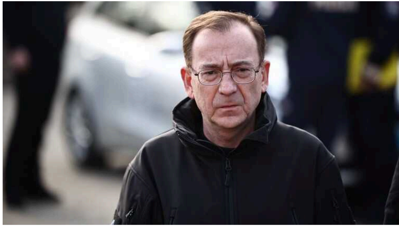
Ексглава МВС Польщі Камінський, відправлений до СІЗО, оголосив голодування та назвав себе політв'язнем

Про це повідомив журналістам його соратник Блажій Побожий.