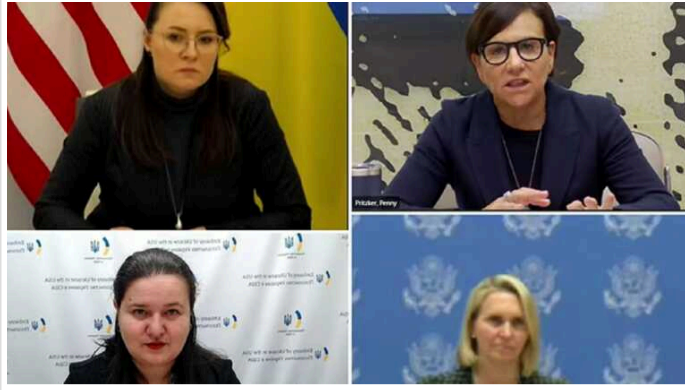
Представники США і міністр економіки Свиріденко обговорили подальший розвиток України

Міністр економіки України Юлія Свиріденко разом із послом в США Оксаною Маркаровою, спецпредставницею США з питань відбудови України Пенні Прицкер та послом США в Україні Бріджет Брінк провели зустріч, на якій обговорили подальший економічний розвиток України.