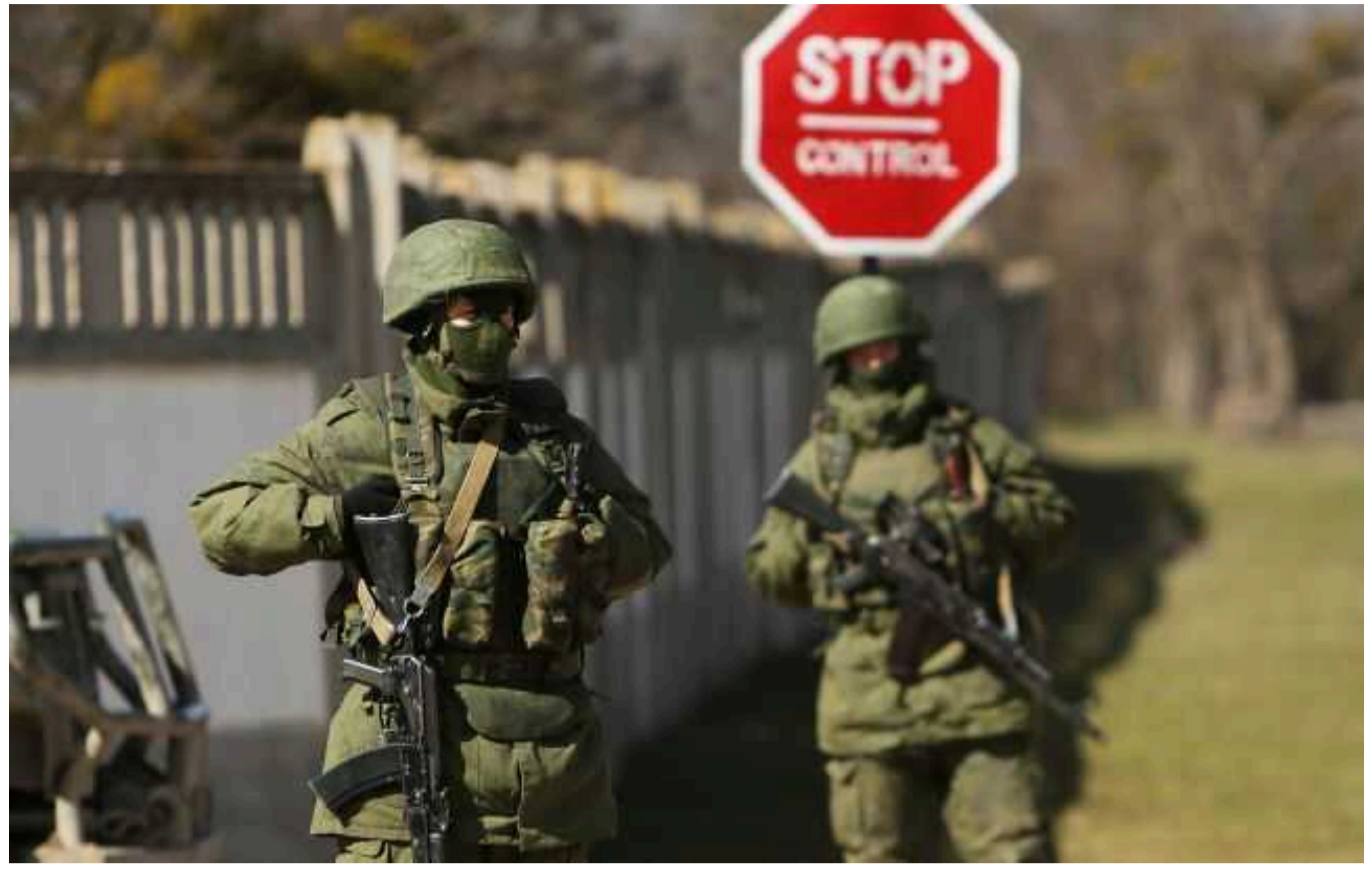
Партизани "АТЕШ" влаштували вилазку до тренувального табору загарбників РФ у Криму

У Криму знайшли чергове місце розташування окупантів, розташоване у Чорноморському. Ним виявився тренувальний табір загарбників, куди партизани влаштували вилазку.