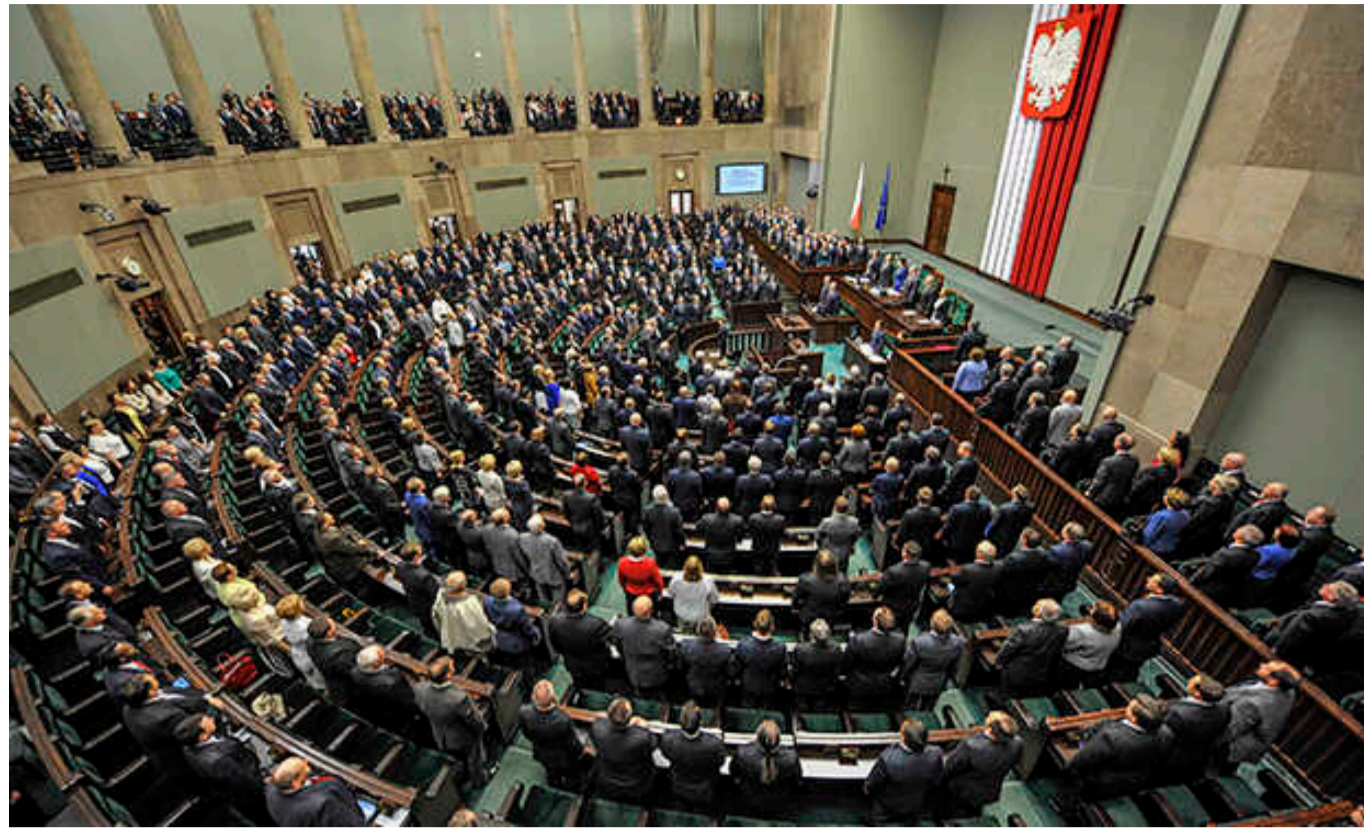
У Сеймі Польщі через візовий скандал хочуть допитати ексглаву МЗС і його заступника

Спеціальний комітет Сейму Польщі хоче допитати колишнього міністра закордонних справ Збігнева Рау та його заступника Пйотра Вавжика у зв'язку з так званим візовим скандалом.