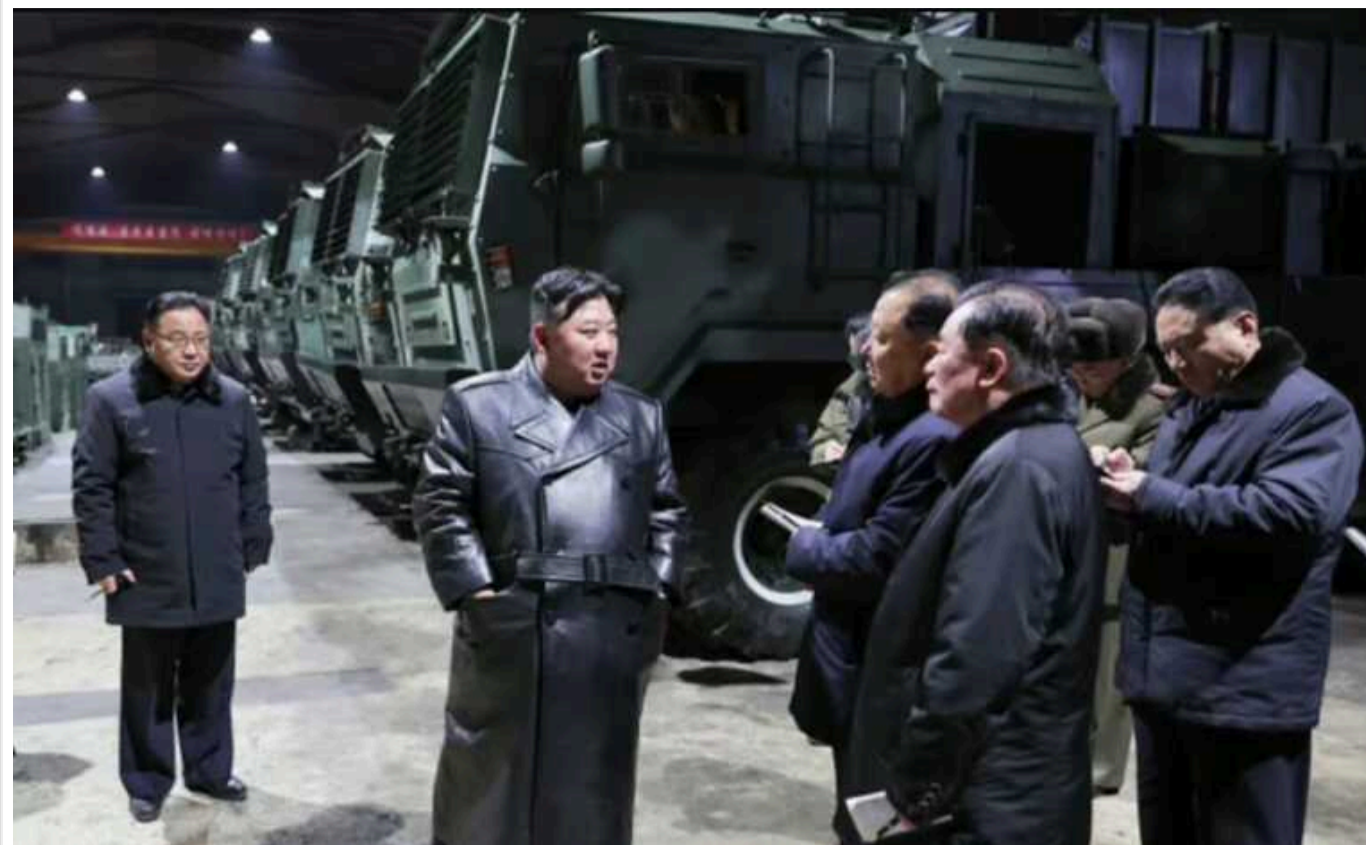
Кім Чен Ин відвідав військові заводи і пригрозив перетворити Південну Корею на попіл

Лідер Північної Кореї Кім Чен Ин проінспектував роботу головних військових заводів країни і зробив кілька погрозових заяв на адресу Південної Кореї, зокрема запевняє, що в разі конфронтації перетворить її на попіл.