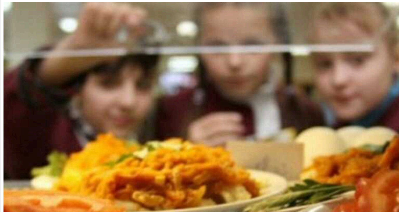
Черкаська міська рада купує для шкільних їдалень м'ясо за завищеною вартістю

Городищенська міськрада, що на Черкащині, уклала договір на постачання 8,5 тонн м'яса та 200 кілограмів курячої печінки у місцеві садочки та школи. На це чиновники планують витратити 1,61 млн грн бюджетних коштів. Журналісти виявили, що у договорі завищено вартість курячого філе, через що міськрада може переплатити понад 200 тис. грн.