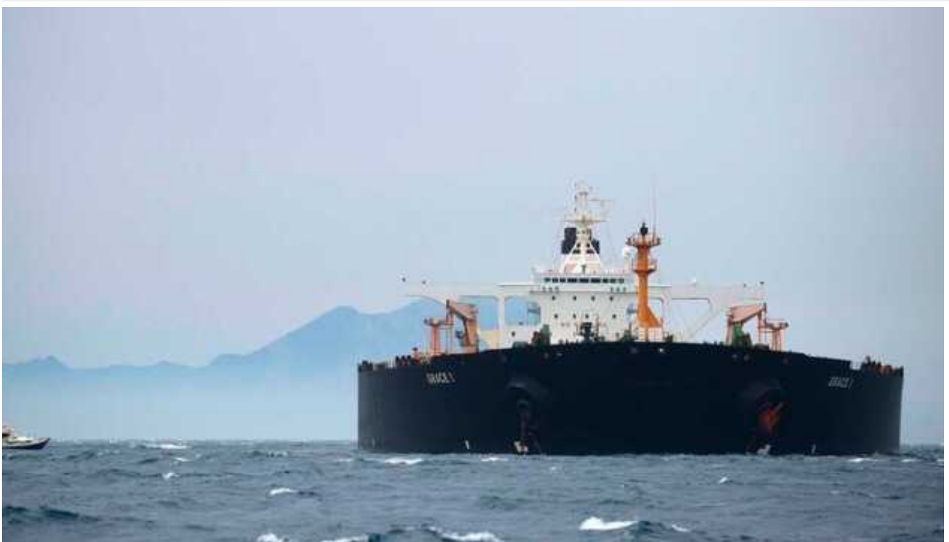
ОАЕ заборонили вхід у свої води танкерам з Камеруну: можуть перевозити російську нафту

Міністерство енергетики та інфраструктури Об'єднаних Арабських Еміратів заборонило вхід в свої води суднам під прапором Камеруну. Таке рішення, в першу чергу, націлене на судна, які використовуються для транспортування нафти, що потрапила під санкції.