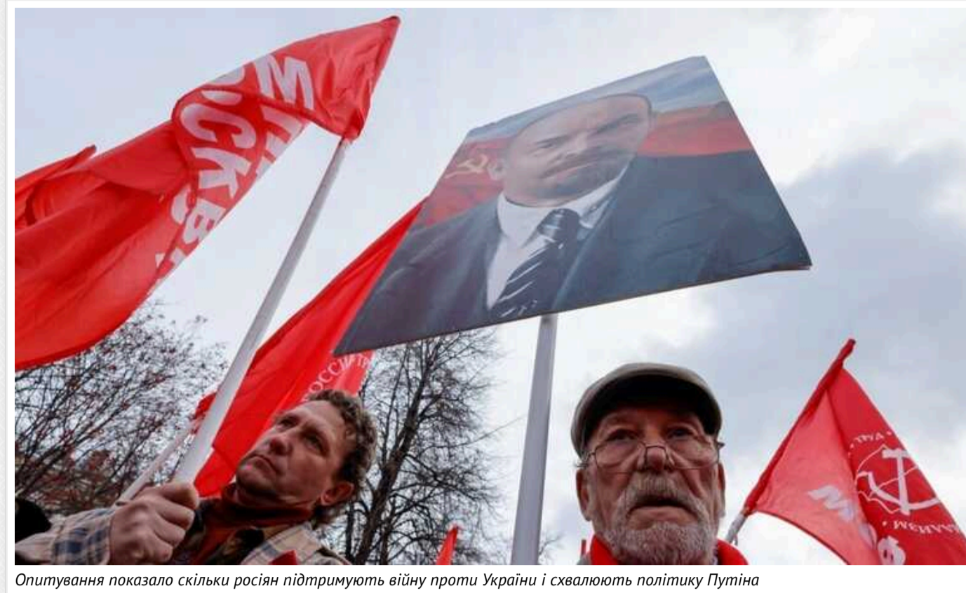
Опитування показало скільки росіян підтримують війну проти України і схвалюють політику Путіна

Близько 63% росіян підтримують війну в Україні, при цьому 64% опитаних розглядають так звану "СВО" як "цивілізаційну боротьбу між Росією й Заходом". Крім того, 56% громадян РФ зазначають, що військові дії вплинуть на їхнє рішення під час майбутніх виборів.