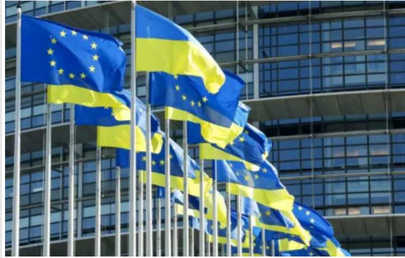
Росія побила усі рекорди за кількістю санкцій, обігнавши навіть Іран

Росія, після початку повномасштабної війни проти України, стала першою у світі країною за обсягом накладених на неї санкцій. Станом на зараз проти російських фізичних та юридичних осіб діють 16 077 санкцій. РФ, у результаті, випередила в антирейтингу навіть Іран.