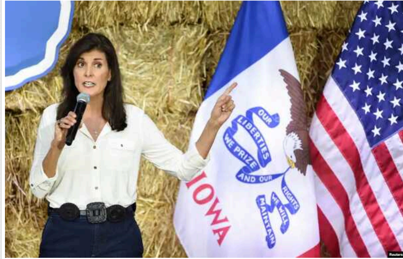
У США республіканка Гейлі суттєво скоротила розрив із Трампом у ключовому штаті

Кандидат у президенти Сполучених Штатів Америки від Республіканської партії Ніккі Гейлі скоротила різницю у рейтингах із Дональдом Трампом у штаті Нью-Гемпшир. Цей штат першим проводить праймеріз серед інших штатів і, таким чином, в основному визначає тренд підтримки кандидатів у США в цілому.