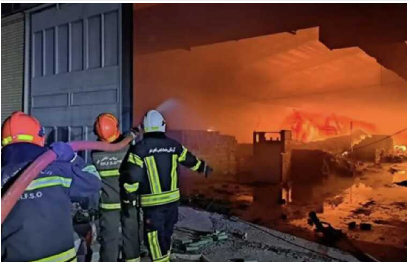
В Ірані стався вибух на одному з заводів: постраждали 53 працівника

У вівторок, 9 січня, в Ірані прогримів вибух на одному із заводів із виробництва косметики. На підприємстві спалахнула пожежа, внаслідок інциденту постраждали 53 людини.