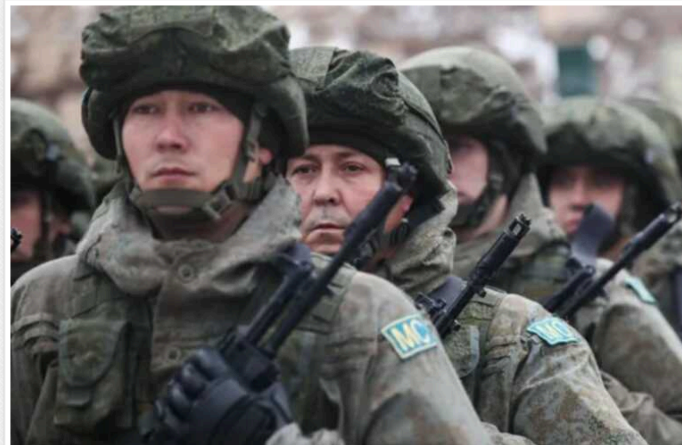
У РФ лунають заклики про масштабний наступ на Харківщину: в ISW оцінили загрози для України

У Росії знову почали лунаати дещо призабуті заклики до нового наступу російських військ на Харківщині. Пропагандисти РФ, услід за речником президента РФ Дмитром Песковим, заговорили про створення на території Харківщини "буферної зони" задля унеможливлення ударів по Белгороду.