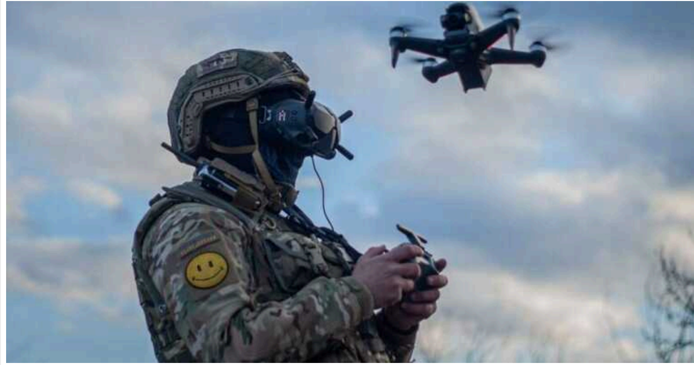
Безпілотник ЗСУ атакував двох росіян, які їхали на вкраденому моторолері

Український ударний безпілотник атакував двох росіян, які їхали на вкраденому моторолері. В результаті атаки один з окупантів зістрибнув на ходу з транспорту, іншого було успішно ліквідовано.