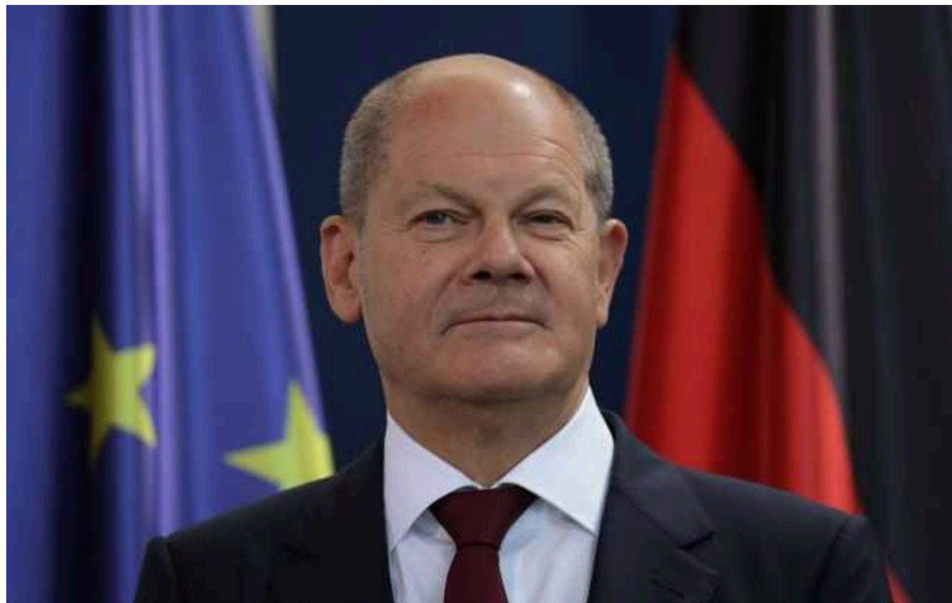
Politico: Шольц на саміті ЄС у лютому хоче провести окремі дебати щодо зброї для України

Канцлер Німеччини Олаф Шольц на майбутньому саміті лідерів Європейського союзу 1 лютого планує на окремих дискусіях обговорити військову допомогу для України. Зокрема, хоче закликати деякі країни збільшити оборонні постачання.