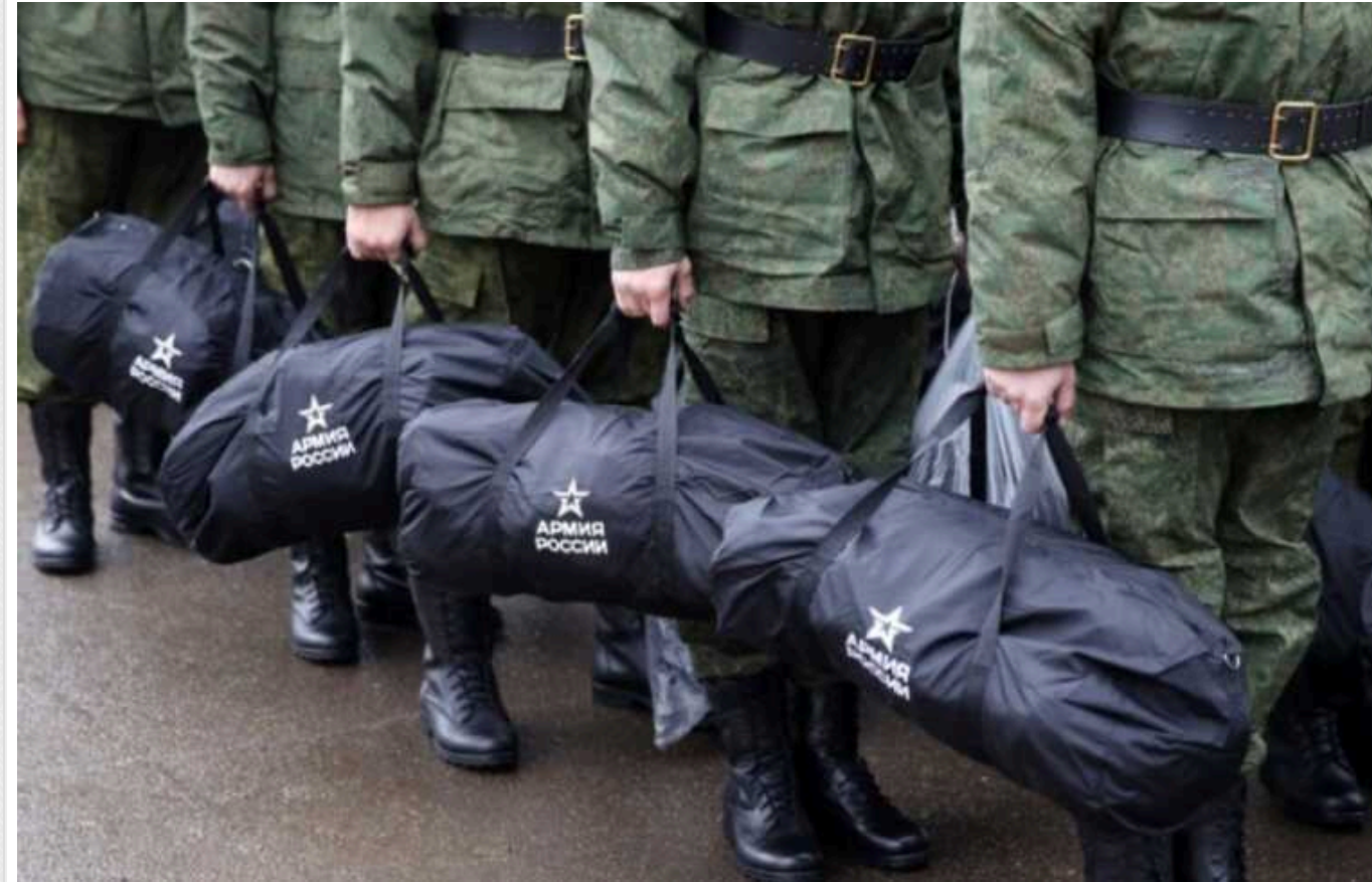
У РФ навесні після указу Путіна можуть мобілізувати близько 400 тисяч росіян