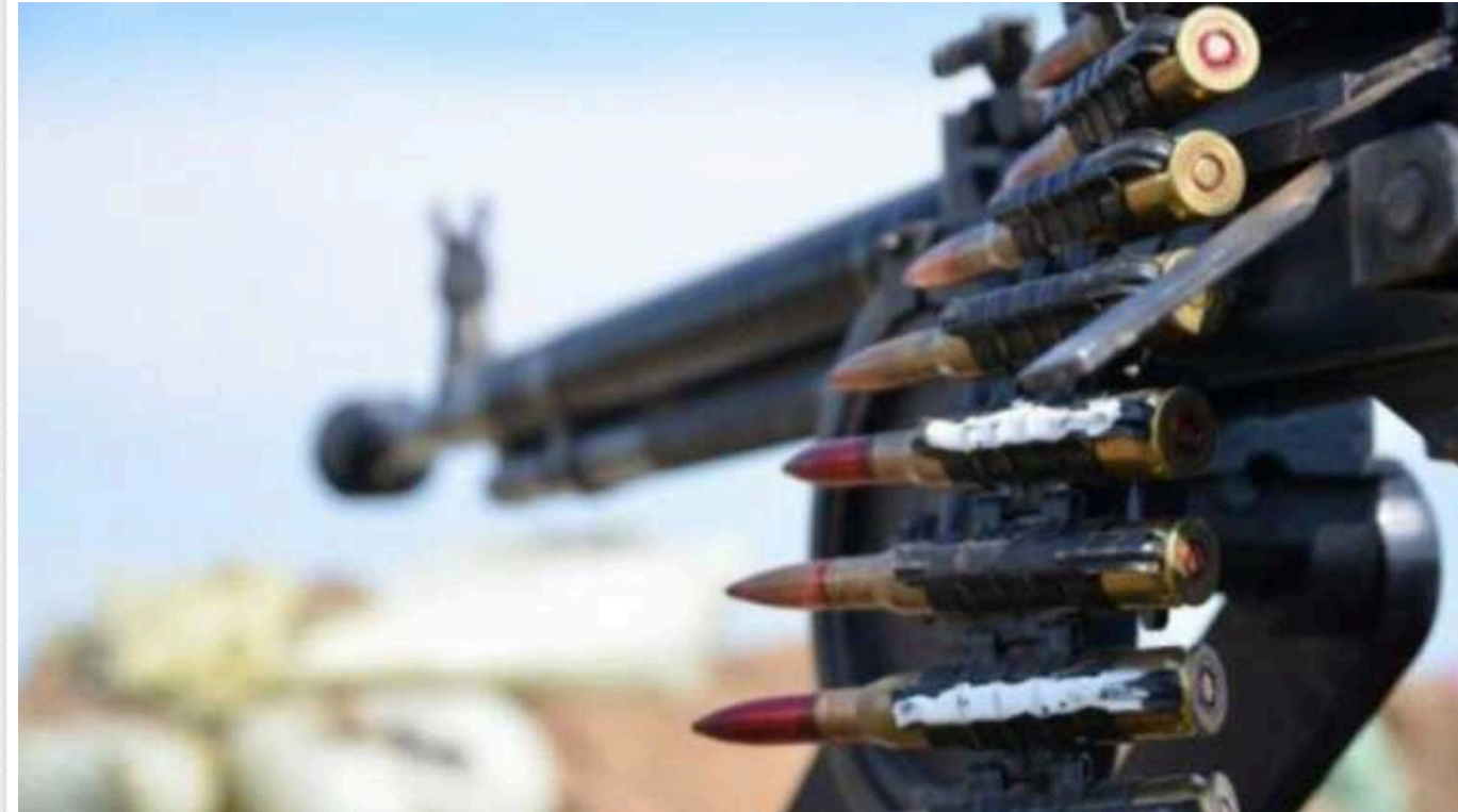
Командування РФ повернулося до старої тактики і жене під Авдіївку на забій військовослужбовців із "ДНР"

У районі Авдіївки командування російських окупаційних військ (РОВ) повернулося до застосування у штурмових діях переважно піхотної компоненти 1 АК т.зв. "ДНР". Іншими словами, зараз на забій вирушає здебільшого донецька, пише координатор Інформаційного Опору Олександр Коваленко.