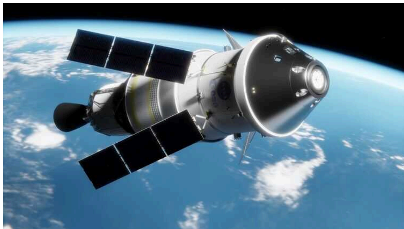
Запуск місячних місій "Артеміда" перенесено на 2025 та 2026 роки, - NASA

Національне управління США з авіонавтики та дослідження космічного простору (НАСА) на рік відклало запуск місячних місій "Артеміда-2" та "Артеміда-3".