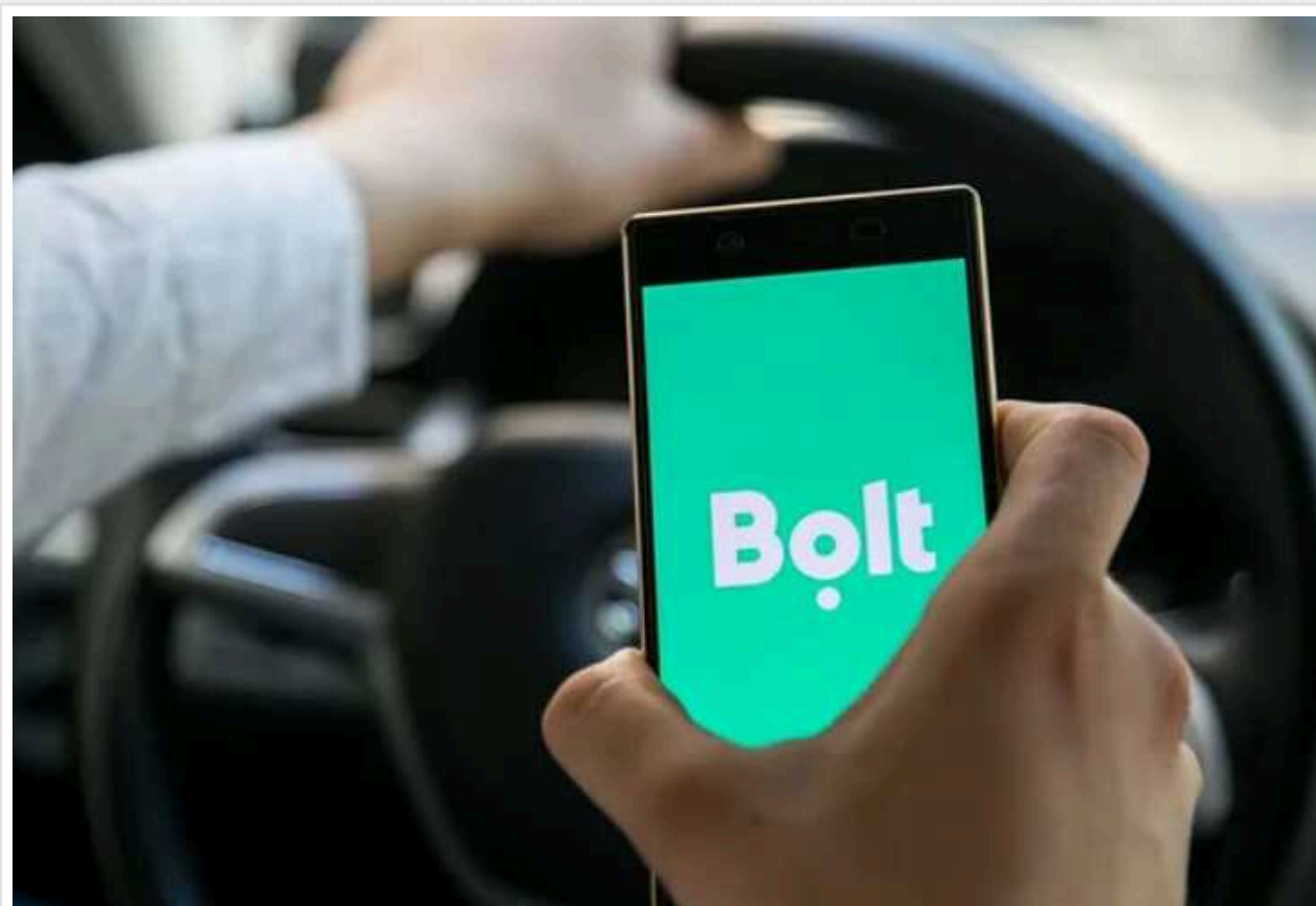
Інцидент у Львові: таксист Bolt відмовився везти військового на милицях

У Львові водій таксі Bolt скасував поїздку військовому на милицях, який чекав на машину 20 хвилин на морозі. У компанії заявили, що "глибоко стурбовані" ситуацією, ретельно вивчають її, і пообіцяли розглянути "з належною увагою".