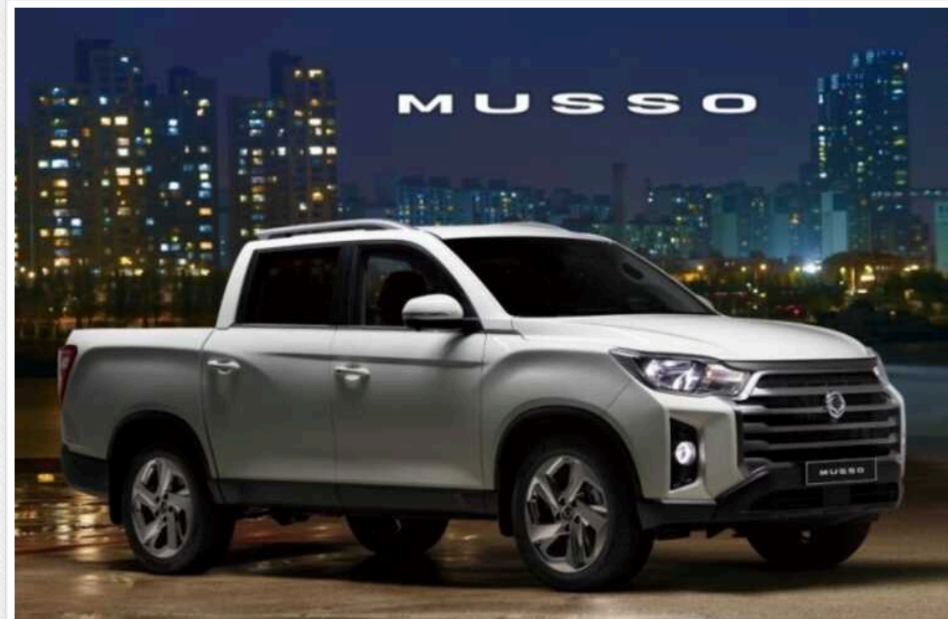
В Україну повернувся відомий корейський автовиробник SsangYong

KG Mobility – нова назва бренду SsangYong . На перших порах в Україні буде представлений рамний пікап Musso в стандартній і подовженій модифікаціях.