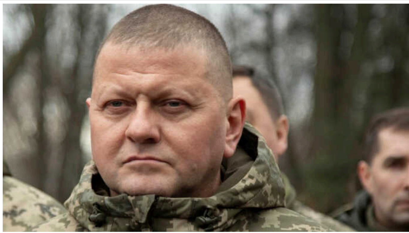
Головком Залужний хотів провести контрнаступ на півдні з метою виходу до кордонів Криму ще 2022 року, але проти цього виступили американці

Про це пише у своїй книзі головний кореспондент Wall Street Journal Ярослав Трофімов.