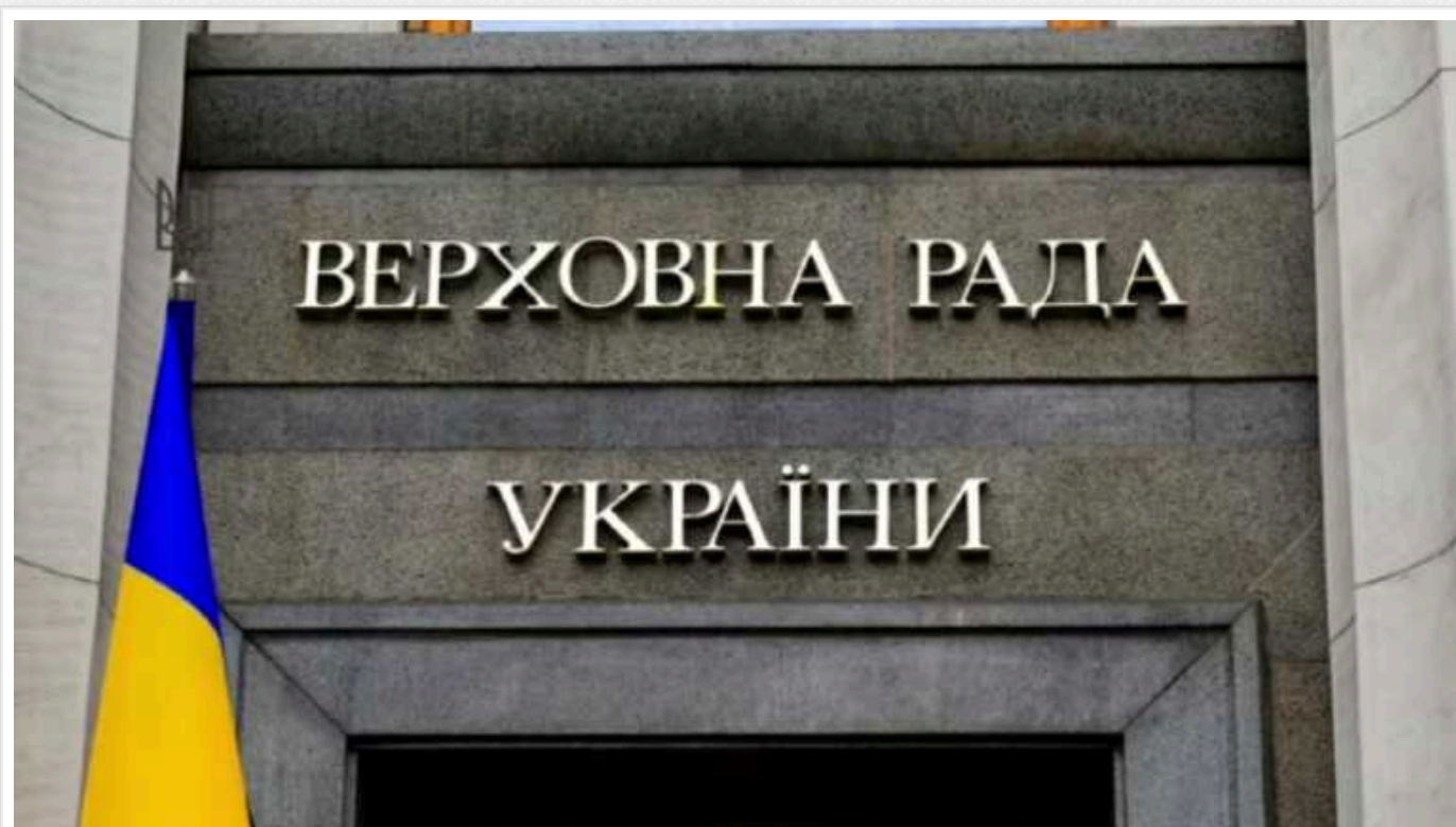
Розгляд комітетом Верховної Ради законопроекту про мобілізацію перенесено на середу

Комітет Верховної Ради з питань національної безпеки, оборони та розвідки переніс на середу 10 січня розгляд урядового законопроекта щодо мобілізації.