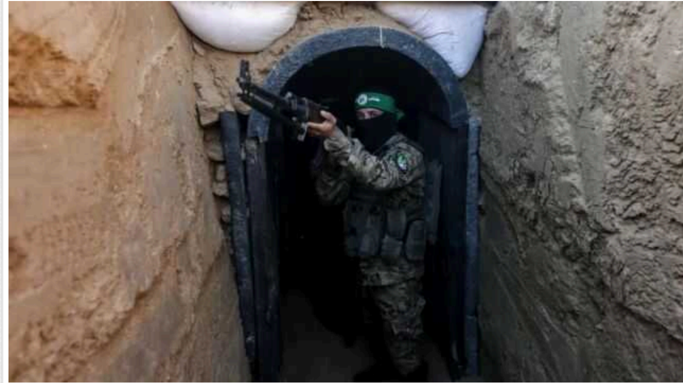
У заручниках ХАМАСу у Секторі Гази залишаються двоє громадян Британії

Серед людей, яких все ще утримують у заручниках бойовики ХАМАС у секторі Гази, є двоє громадян Британії.