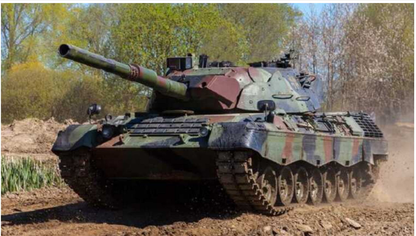
Оборонна компанія з Німеччини буде в Україні ремонтний центр бронетехніки

На заході України німецька оборонна компанія Flensburger Fahrzeugbau Gesellschaft почала будівництво сервісного центру бронетехніки. Зокрема, там ремонтуватимуть танки Leopard .