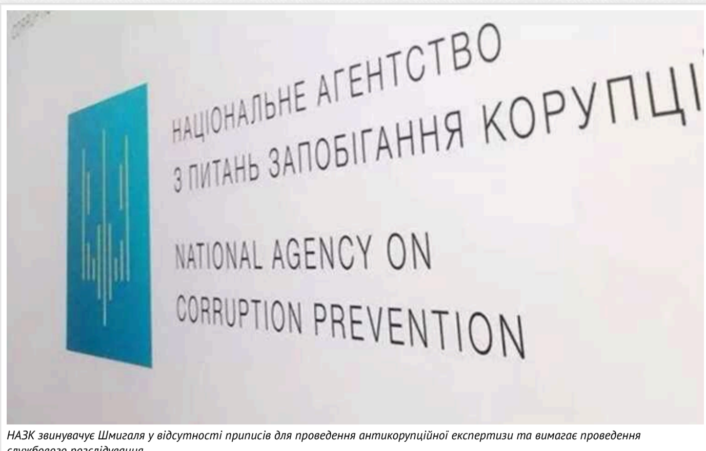
НАЗК звинувачує Шмигалья у відсутності приписів для проведення антикорупційної експертизи та вимагає проведення службового розслідування

Національне агентство з питань запобігання корупції (НАЗК) звинувачує прем'єр-міністра Дениса Шмигалья у ненаданні постанов для проведення антикорупційної експертизи.