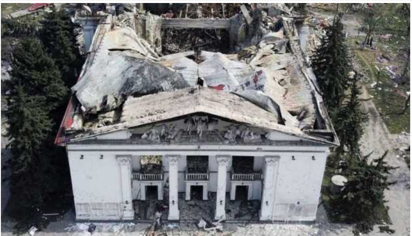
Мерія італійського міста Модена відкликала дозвіл на проведення пропагандистської виставки про Маріуполь

Мерія італійського міста Модена відкликала дозвіл на проведення пропагандистської виставки про окупований Маріуполь. Україна закликала й інші міста світу не надавати майданчиків для подібних російських провокацій.