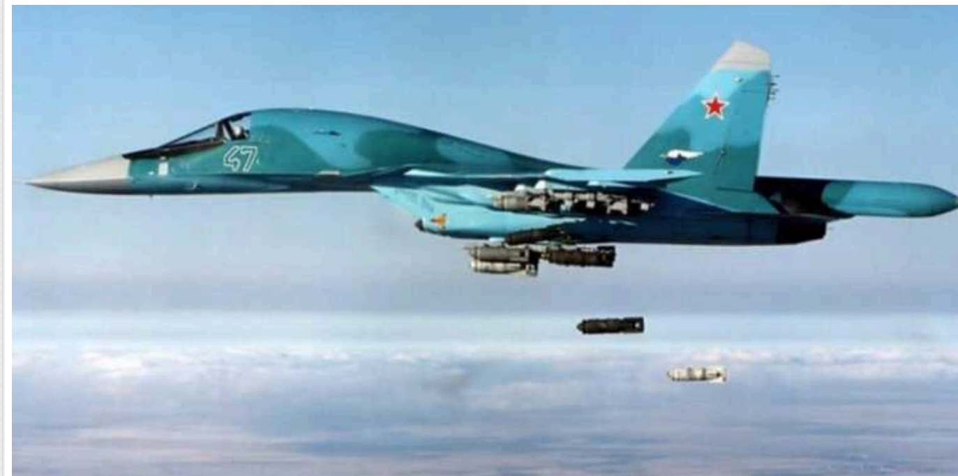
Удари по аеродромах у Криму: "відповідь" ЗС РФ свідчать про успіх ЗСУ, - розвідка Британії

У відомстві наголошують, що атаки українських військових по об'єктах окупантів на території півострова погіршили поінформованість та прикриття ППО над регіоном.