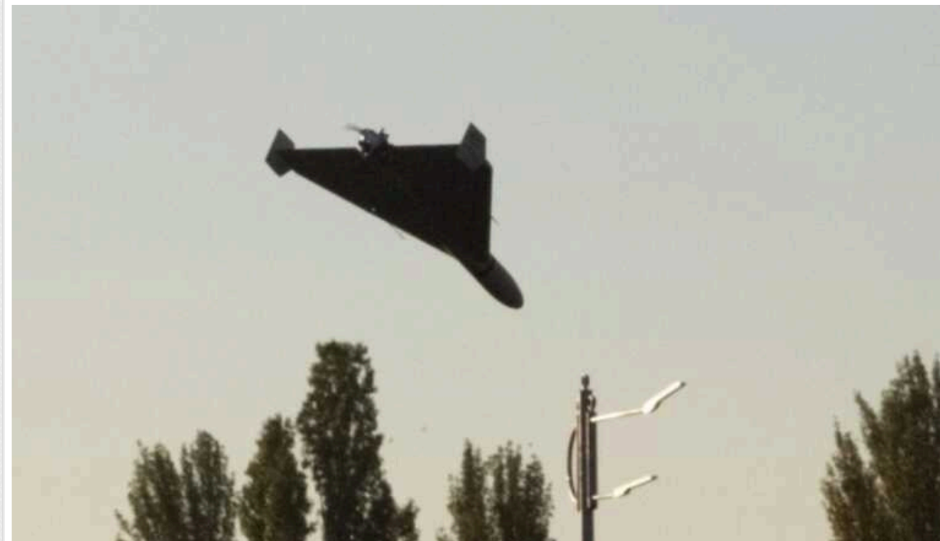
СБУ викрила чергового "блогера", який знімав атаку БПЛА на Хмельницький

За інформацією служби безпеки, чоловік опублікував відео в режимі реального часу та вказав напрямок, куди летіли ворожі ударні дрони. Невдовзі зловмисника виявили, він визнав свою провину та вибачився на відео.