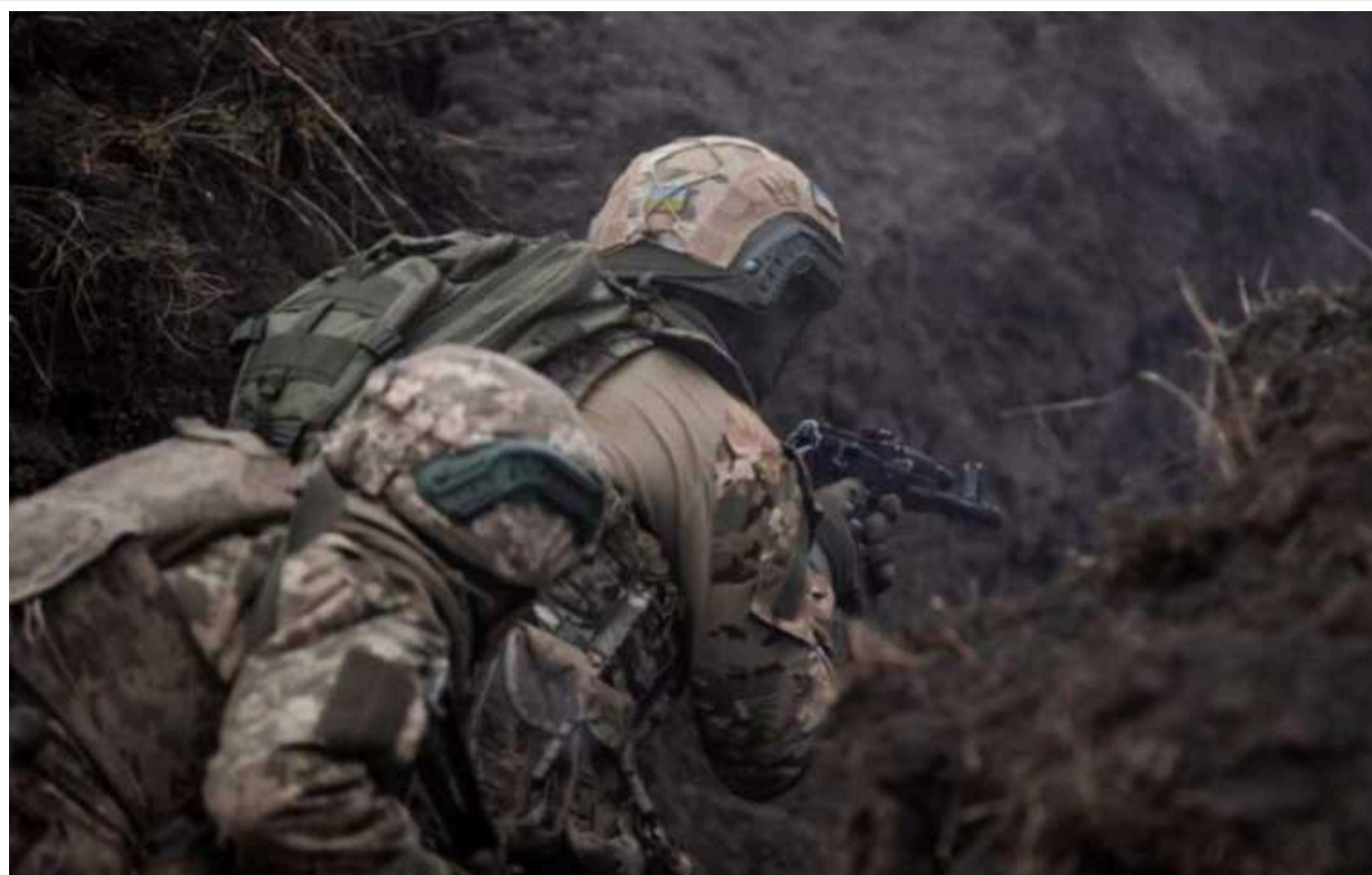
Морпіхи ЗСУ "помножили на 0" окупантів під Кринками

Російські окупанти накопичили резерви і пішли в атаку. До цього вони кілька днів не застосовували техніку, розповів лейтенант ЗСУ з позивним "Алекс".