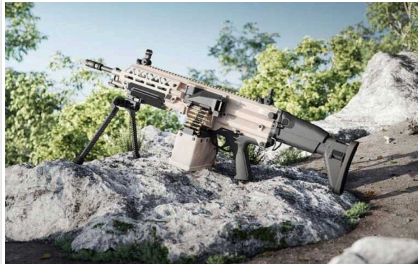
Франція та Бельгія отримала на озброєння новий легкий кулемет FN Evolys

Експерти зазначають, що кулемет забезпечує вогневу міць в умовах сучасних міських боїв, водночас в експлуатації він нагадує штурмову гвинтівку внаслідок невеликої ваги.