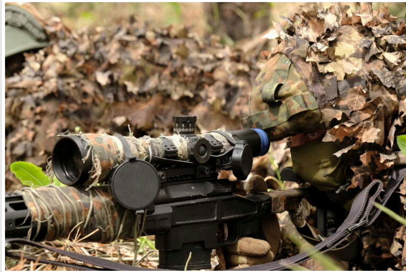
Нацгвардійці показали, як українські снайпери мінують окупантів біля Авдіївки

Українські воїни продовжують тримати оборону на Авдіївському напрямку, одночасно суттєво "проріджуючи" лави окупантів. Окрім артилеристів, ракетників та пілотів ударних БЛА, мінують російських загарбників і снайпери.