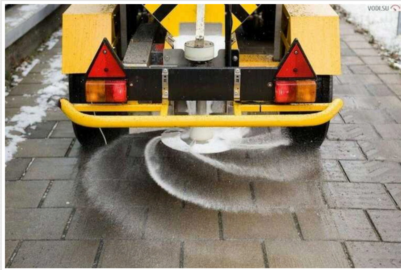
Оточення Вілкула посипатиме дороги Кривого Рогу сіллю за чверть мільярда

Департамент розвитку інфраструктури міста виконкому Криворізької міської ради Дніпропетровської області 1 січня за результатами тендеру замовив ТОВ «Весташляхбуд» утримання автошляхів на 249,97 млн грн.