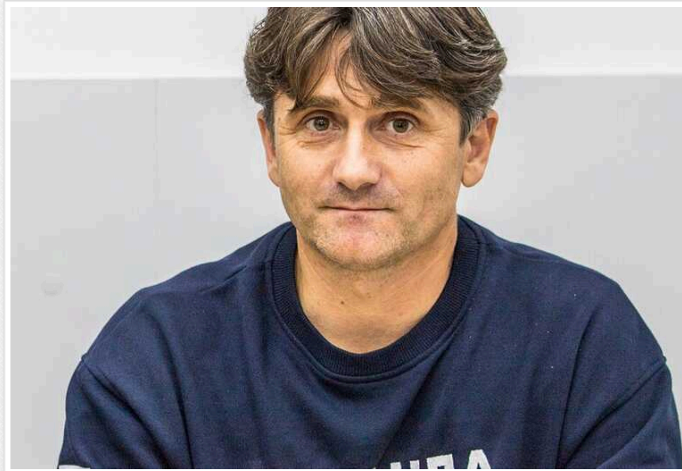
Терорист Берич влаштував скандал і звернувся до Путіна: росіяни на фронті б'ють сербів і відправляють на "м'ясні" штурми

Сербські найманці воюють в Україні із 2014 року. Але зараз щось пішло не так. Відомий міжнародний шанувальник Путіна та терорист Деян Берич записав відео зі скаргою про те, що в російській армії погано ставляться до сербів.