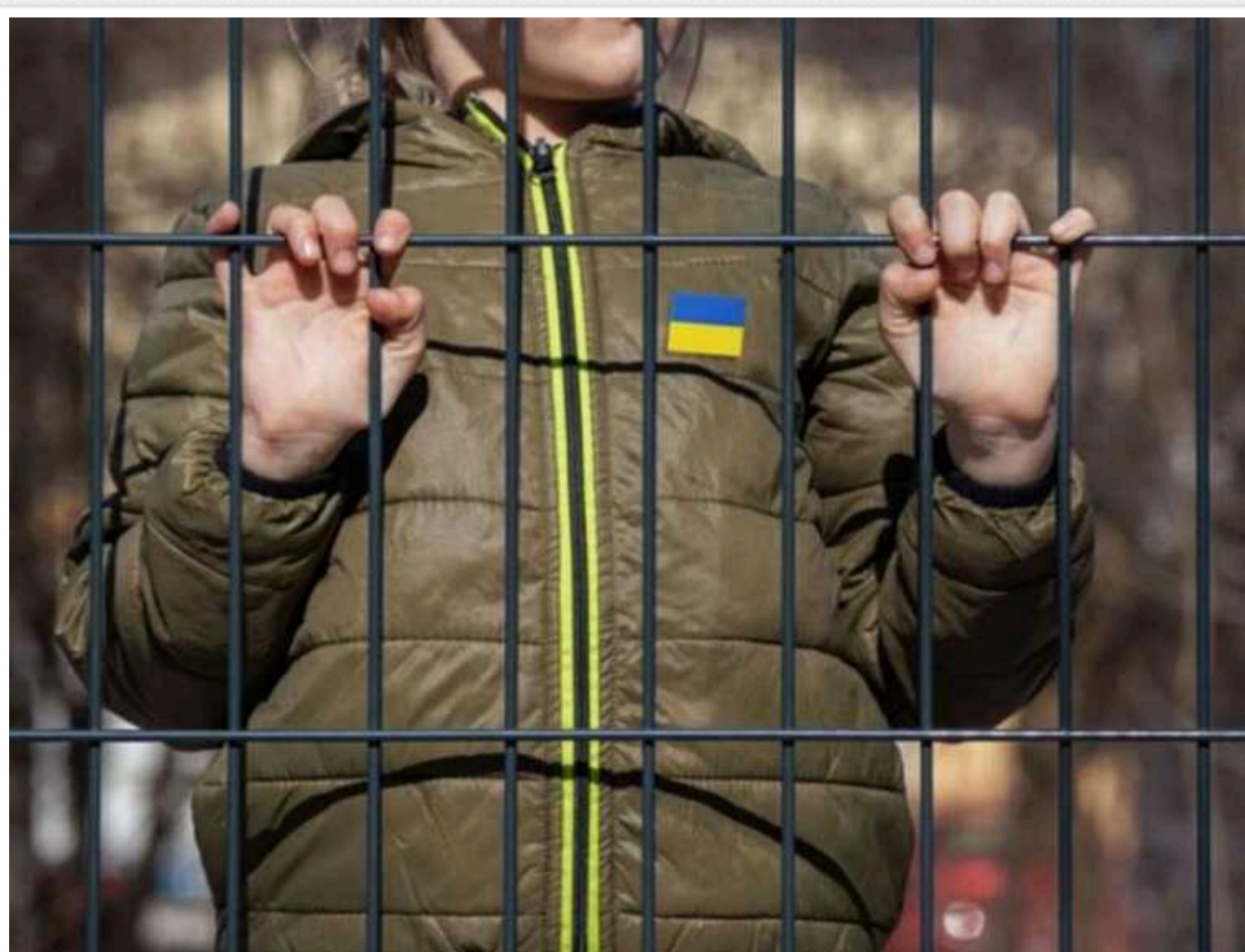
Річ не лише в територіях, а й у людях, і викрадення українських дітей окупантами це доводить

Війна жорстока, вона нікого не жаліє, зокрема й дітей. Не винятком є й ніякіша російсько-українська війна. Росіяни, які вторглися до України, не проводять різниці між військовими, цивільними й дітьми: вони обстрілюють місця, пов'язані з дітьми, такі як школи, лікварні, так само часто, як і інші. Обстріли спричиняють високий рівень убивств і каліцтв дітей. Станом на 10 грудня 2023 року, за даними Офісу генпрокурора України, загинуло 512 і поранено щонайменше 1152 українські дитини.