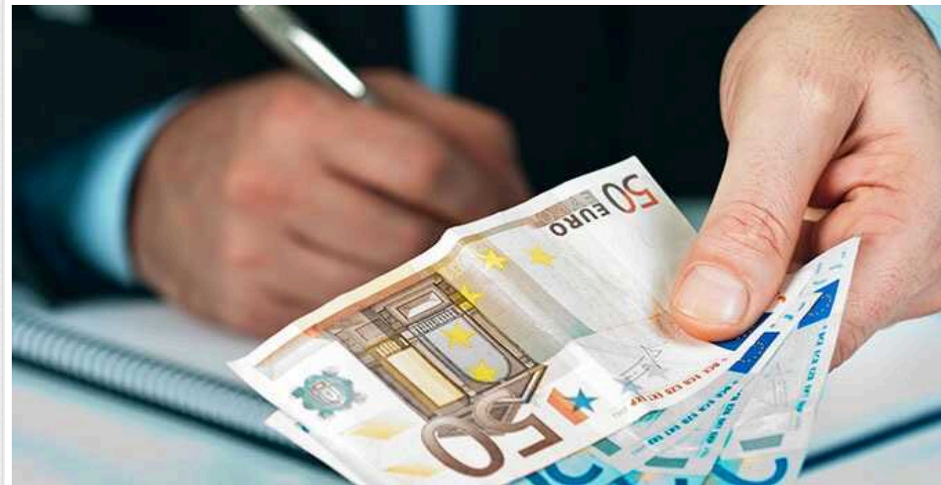
Bild: У Німеччині як мінімум 150 тисяч людей можуть втратити допомогу з безробіття

Допомога з безробіття у Німеччині може втратити щонайменше 150 тисяч осіб, що заощадить бюджету близько 150 мільйонів євро у перші два місяці.