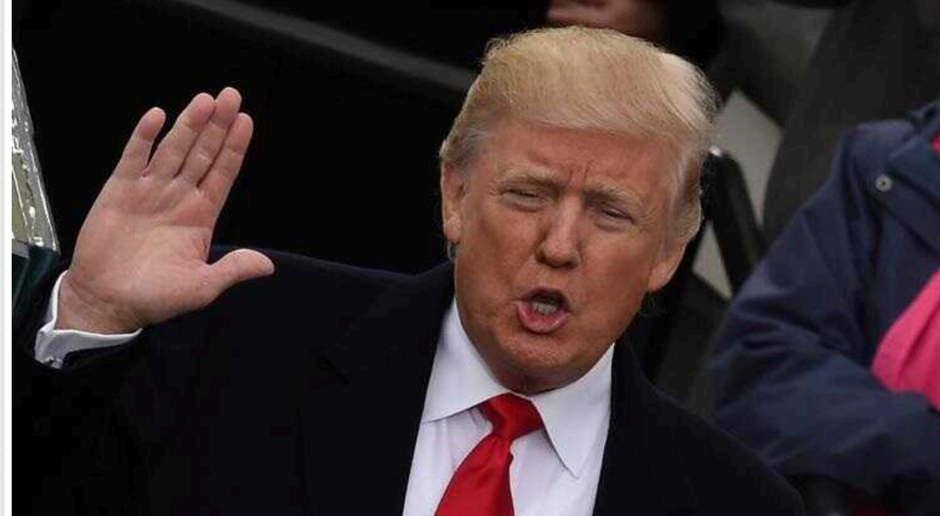
Скандал у США: Трамп вимагає негайно звільнити главу Пентагону

Експрезидент США Дональд Трамп вимагає, щоб адміністрація Джо Байдена негайно звільнила міністра оборони Ллойда Остіна з посади.