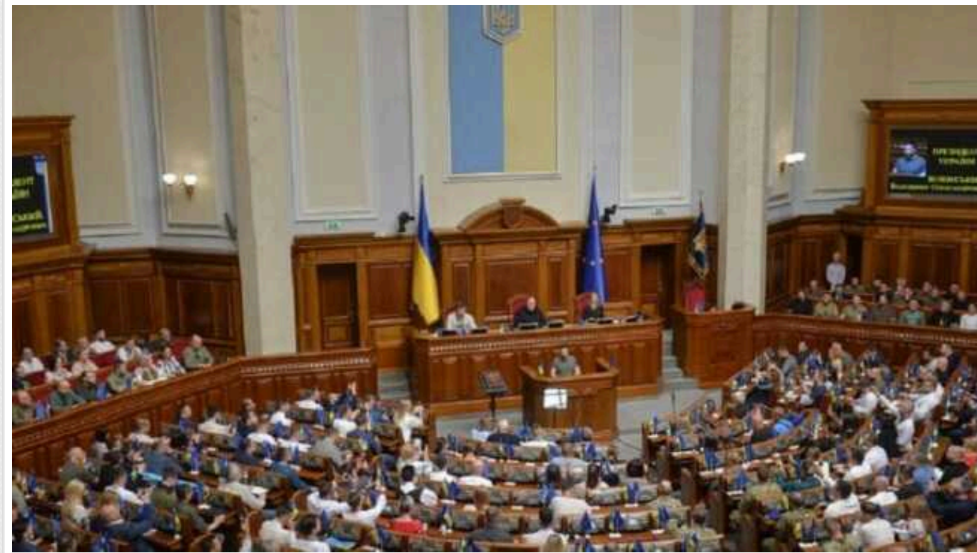
На сайті Верховної Ради зареєстрували п'ять різних версій законопроекту про мобілізацію

Комітет із оборони у вівторок, 9 січня, має винести своє рішення щодо закону про мобілізацію. На сайті ВР зареєстрували п'ять версій відповідного законопроекту. Серед них – один урядовий та чотири альтернативні.