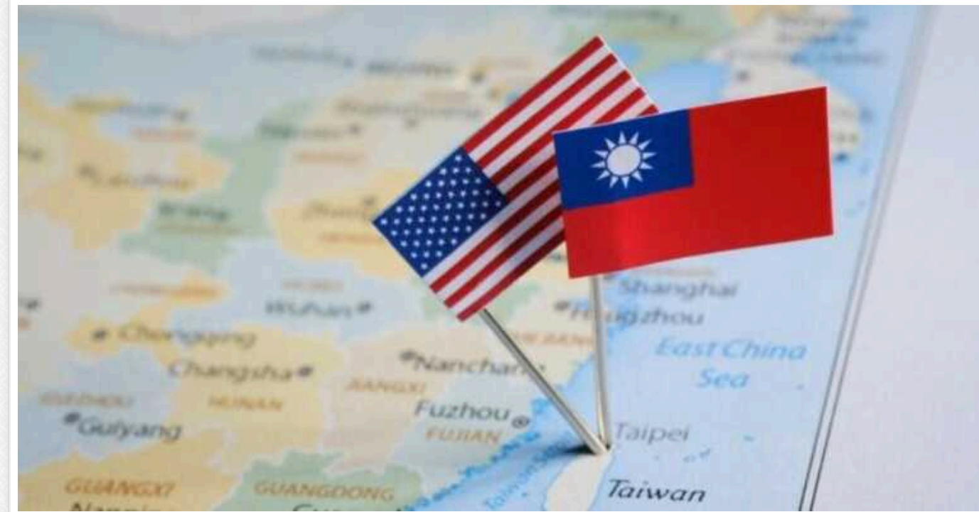
При вторгненні Китаю до Тайваню війна коштуватиме світу 10 трильйонів доларів, – Bloomberg Economics

При вторгненні Китаю до Тайваню війна обійдеться світу в $10 трлн, що відповідає приблизно 10% світового ВВП.