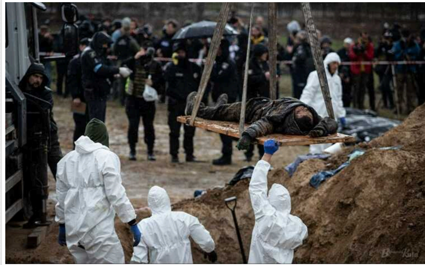
З початку вторгнення за фактом злочинів окупантів відкрито 111 тисяч кримінальних проваджень, – Нацполіція

З початку повномасштабного вторгнення Росії в Україну слідчі Національної поліції України розпочали 111 112 кримінальних проваджень за фактами вчинення на території України злочинів військовослужбовцями збройних сил Російської Федерації та їхніми пособниками.