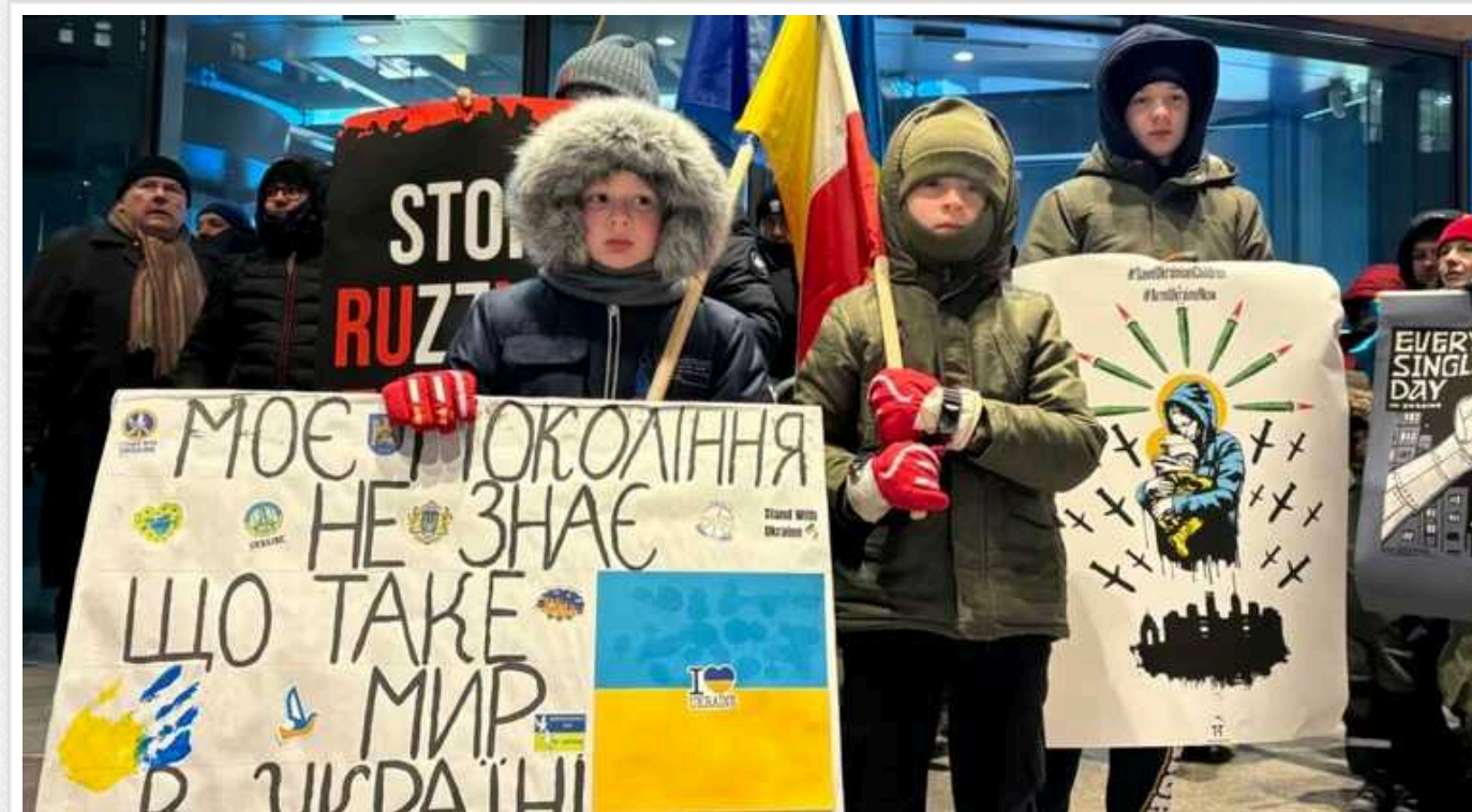
У Варшаві відбулася акція біля представництва ЄС: «Зброю для України»

У столиці Польщі відбулася багаточисельна акція «Stop Russian Terror», повідомляє кореспондентка Радіо Свобода.