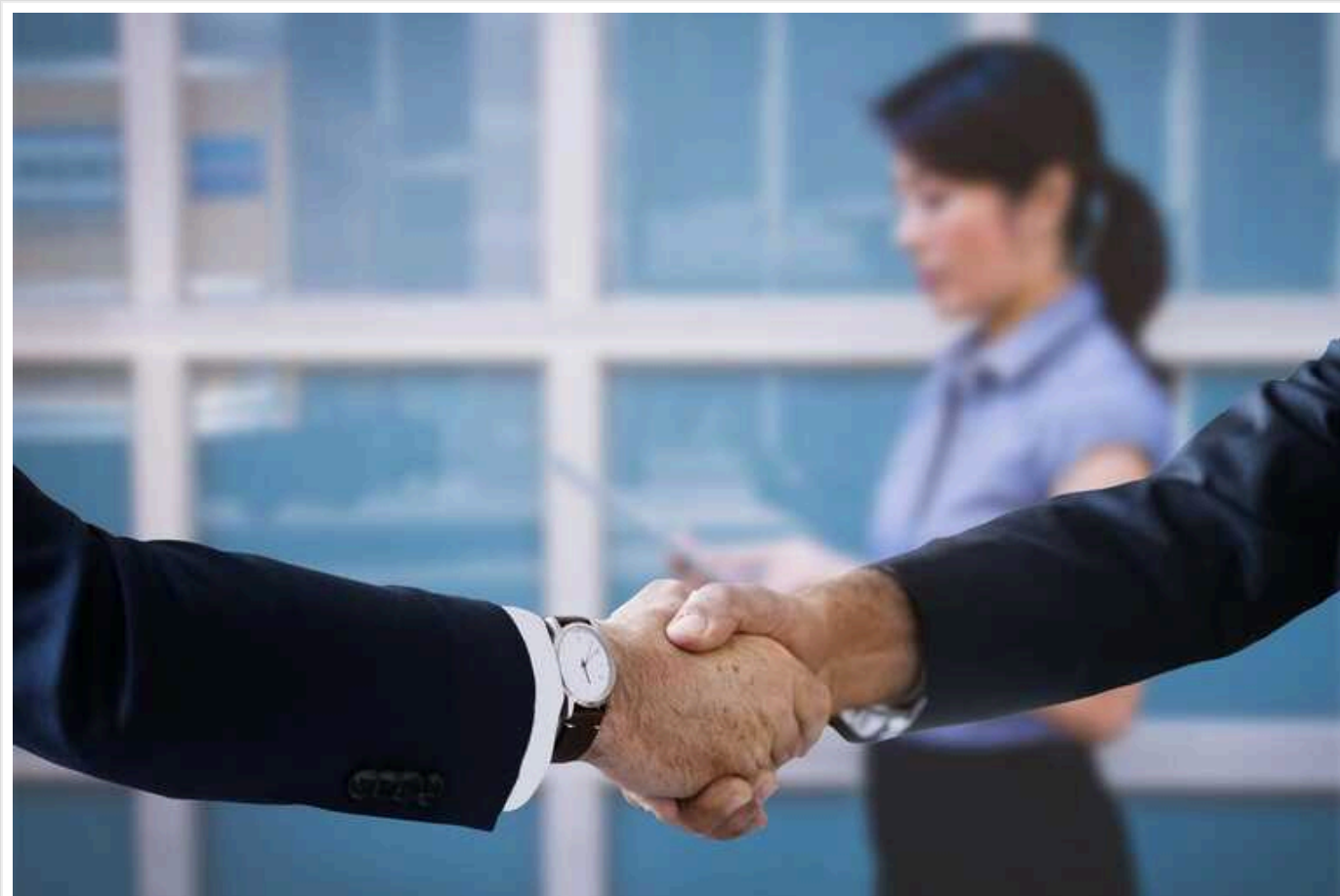
На Київщині у 2023 році працевлаштували 1,8 тис. переселенців

У 2023 році у Київській області були працевлашовані 1,8 тис. внутрішньо переміщених осіб. 724 особи були залучені до суспільно корисних робіт проекту "Армія відновлення".