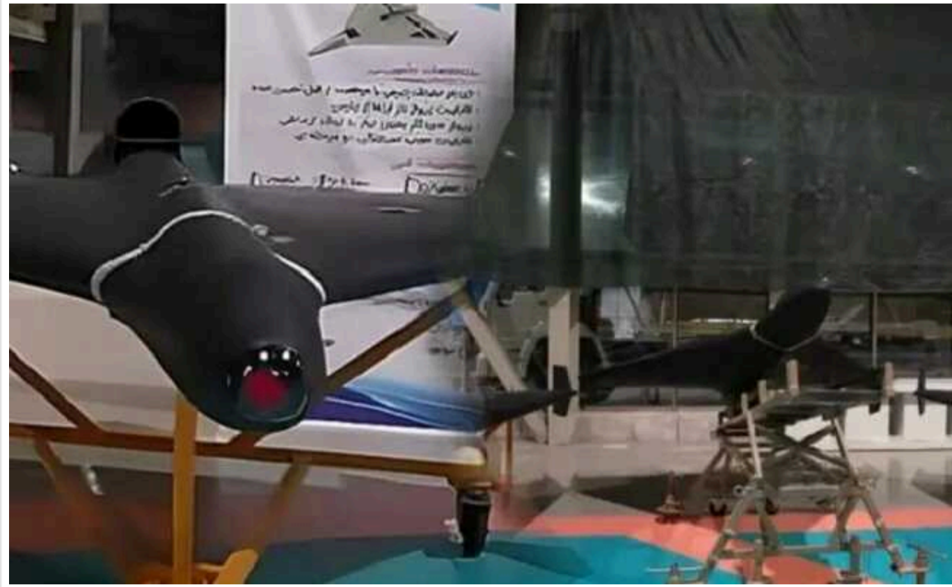
На території України збили перший реактивний "шахед"

На території України збили перший безпілотник "Шахед 238" із реактивним двигуном.