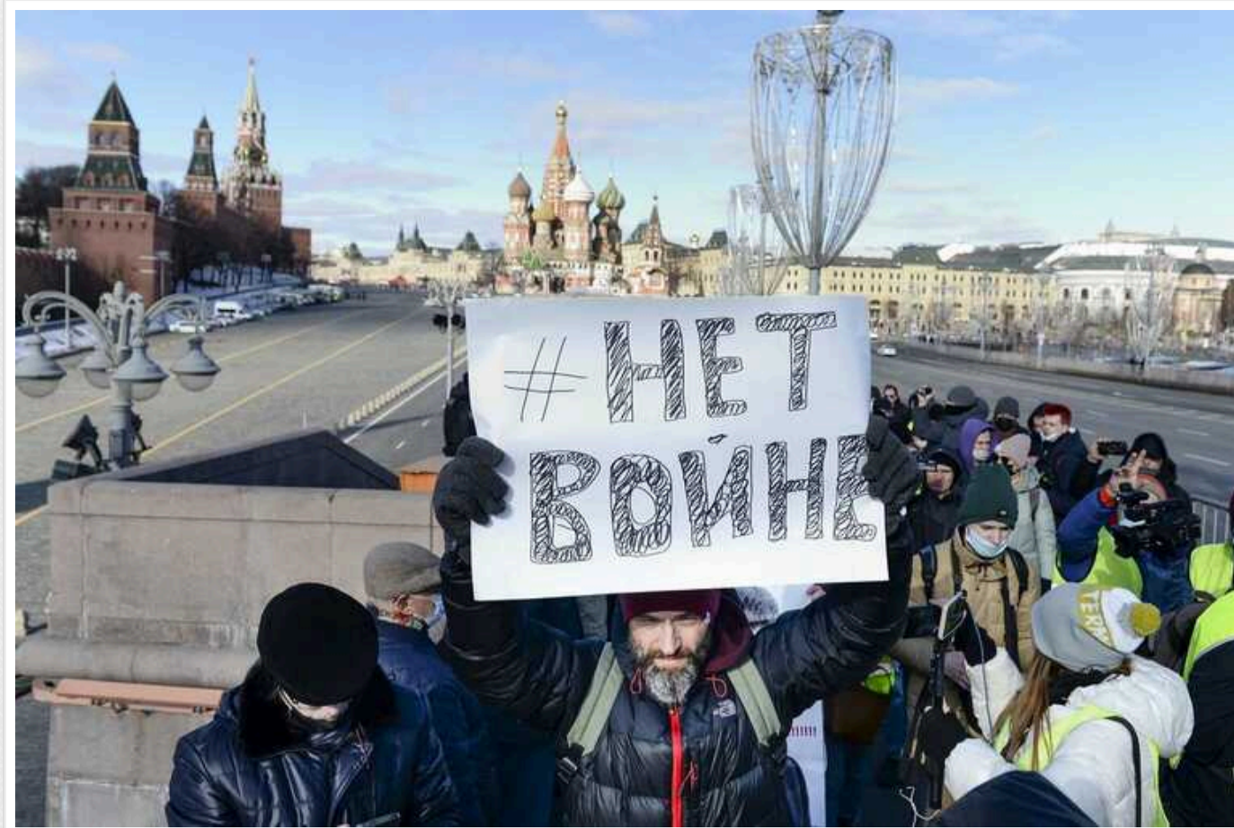
У РФ перед виборами знизилася підтримка війни проти України, влада намагається посилити контроль над інфопростором, – ISW

Влада Росії продовжує зусилля щодо консолідації контролю над інформаційним простором перед березневими президентськими виборами. Вона взялася карати медіа та окремих громадян за поширення "фейків", в яких нібито дискредитується російська армія.